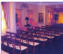
Capilla amplia y confortable