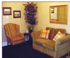
Le servimos tomando en cuenta sus costumbres y deseos.